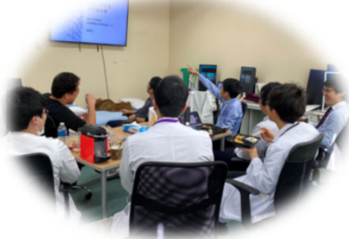
レジデントによる勉強会

初期研修の2年間ではすべての密を達成するのは難しいと思います。まずは放射線腫瘍科の説明会に参加することが大切です。小児から高齢者、緩和治療から根治治療、臓器を問わずがんに向かう仲間を募集中です。