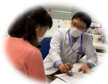
治療の説明、照射中の診察 治療後のフォロー